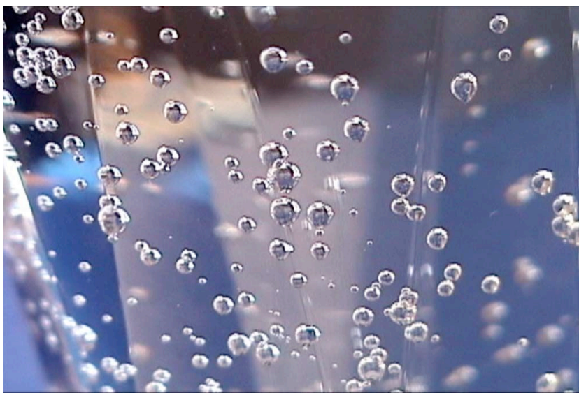
Yun Aiyong, CAN YOU FEEL ? (Corée)

Dans chaque pays, une artiste crée une œuvre-vidéo d'une durée comprise entre 1 et 2minutes qui vient s'ajouter à celles d'autres artistes afin de constituer un « collage » - vidéo.