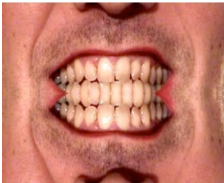
Cagdas Kahrman, DANS LES DENTS DE L'OPPOSITION (Turquie)